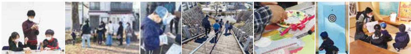
2022年度の「中之条芸術大学」の様子 (協力: 中之条町歴史と民俗の博物館「ミュゼ」、清見寺)

年度に始まりました。このたび、誰もがアートに親しむ場づくりに貢献する人材育成の一環として関わることになりました。教員の出品のほか、学生たちも共生の遊び場づくりやボランティアとして参加しています。